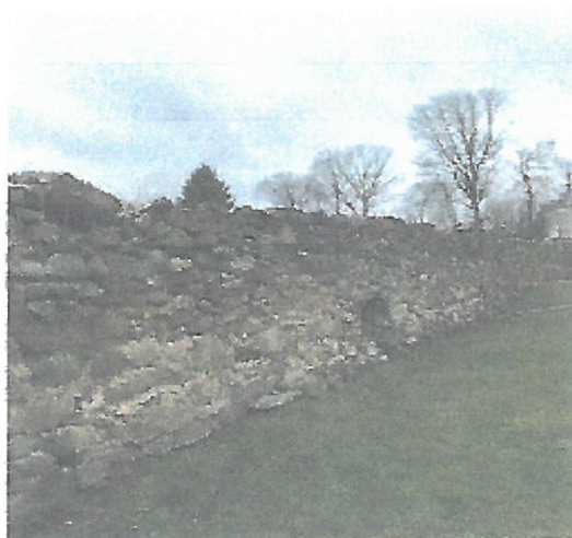
Odcinek muru do spoinowania i wykonania okapnika