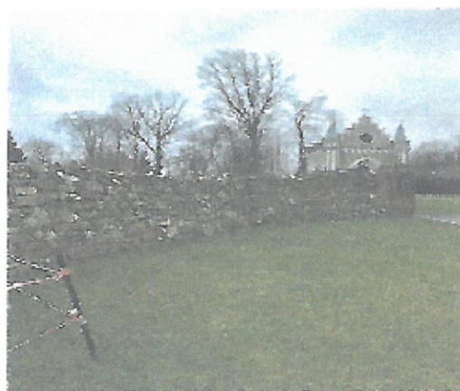
Odcinek muru do spoinowania i wykonania okapnika