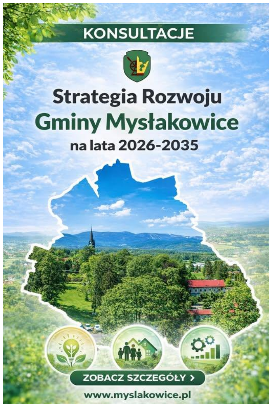
Rysunek 1: Plakat informacyjny dotyczący konsultacji społecznych

2026 r. poprzez złożenie formularza uwag zamieszczonego na stronie: https://eurzad.myslakowice.pl/konsultacje .